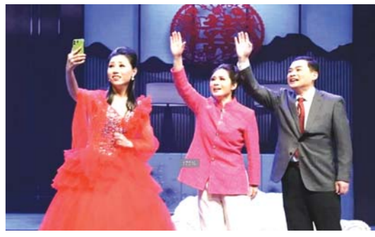
莱芜椰子小戏《泉水叮咚荷花香》剧照

□记者 卢昱 报道 本报讯 新冠肺炎疫情发生以来，济南市文艺院团的艺术家们用各种形式表达对医务工作者的敬意与祝福。继推出戏曲唱《万众一心托起生命的太阳》和莱芜椰子小戏《莱芜的心愿》之后，济南市莱芜椰子艺术团保护中心又紧锣密鼓排演莱芜椰子小戏《泉水叮咚荷花香》为抗疫宣传助力。遵照科学防疫的注意事项，经过演职人员精心排练和录音，该剧日前顺利完成录像工作。