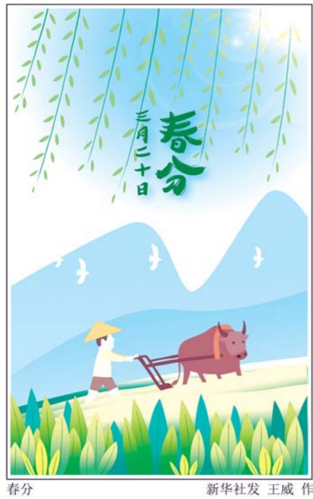
春分 新华社发 王威作

二十四节气起源于黄河流域。远在春秋时代，就定出仲春、仲夏、仲秋和仲冬等四个节气，到秦汉年间，二十四节气已完全确立。春分有三候：“一候玄鸟至；二候雷乃发声；三候始电。”