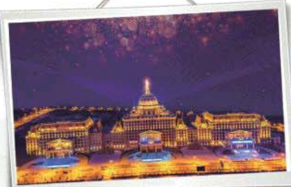
△欢乐城堡度假酒店