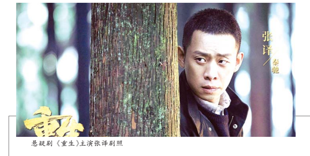
悬疑剧《重生》主演张译剧照

指纹是《重生》的编剧，他的另一部作品正是2017年播出的爆款网剧《白夜追凶》。作为指纹的粉丝，张译一直期待着能有机会合作。