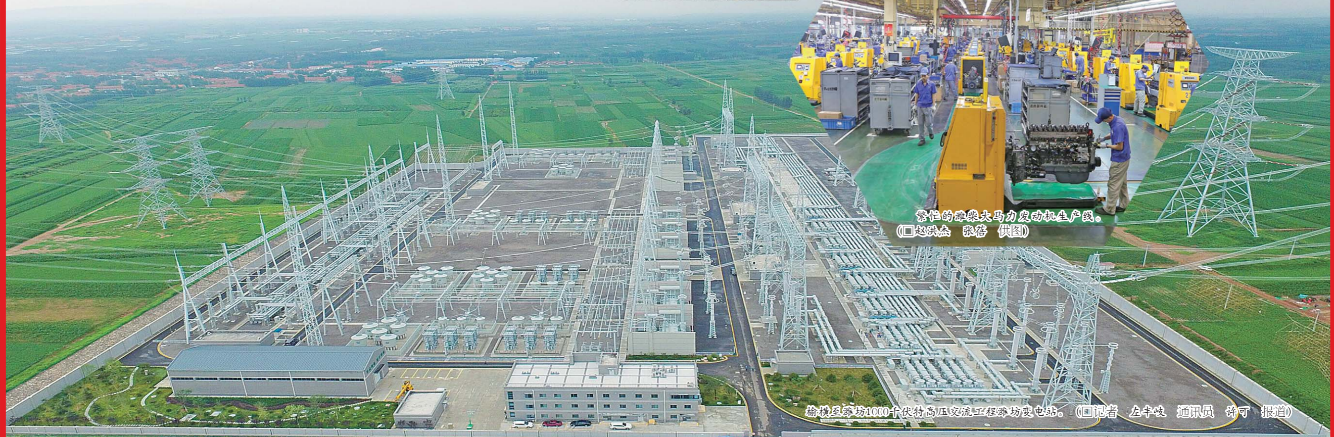
榆林至潍坊1000千伏特高压交流工程潍坊变电站。