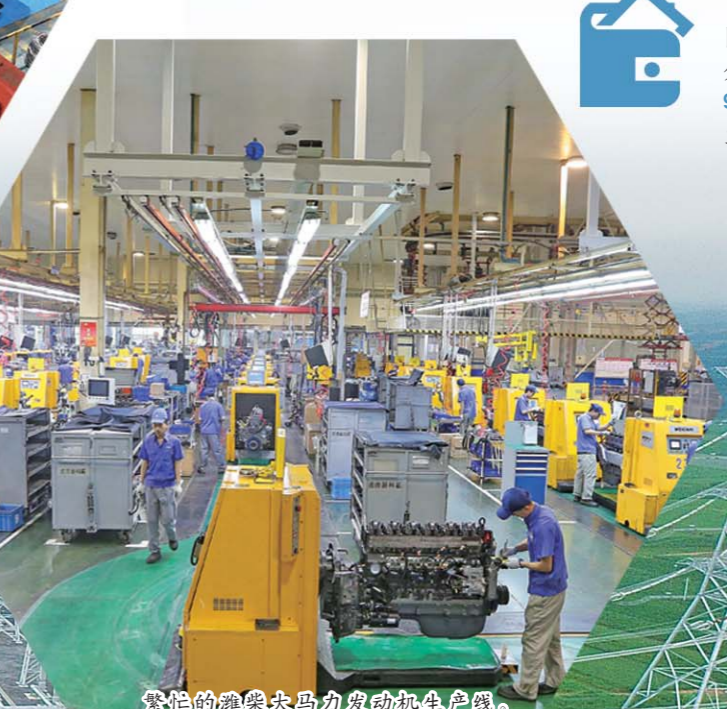
繁忙的潍柴大马力发动机生产线。