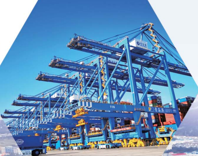
青岛港全自动化码头二期于2019年11月投产运营。