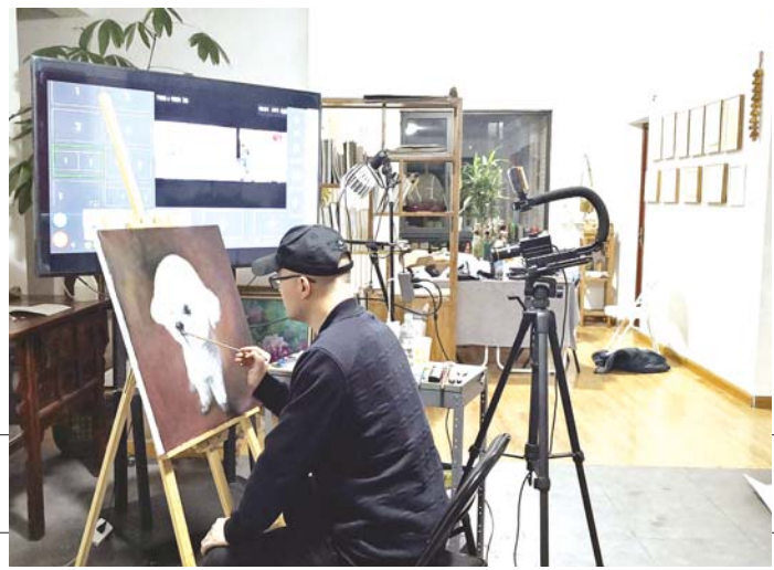
山东美术馆“云课堂”直播现场

“第十三届全国美术作品展览中国画作品展”是我省近年来举办的最高等级的美术作品展，去年展出期间吸引了30余万观众实地参观。为了满足更多观众的观展需求，山东美术馆制作上线了360度全景虚拟展厅。观众打开手机或登录山东美术馆官方网站，就可以身临其境地观看位于不同展厅的各类中国画作品。同时，还可通过扫描二维码的方式，在喜马拉雅平台收听由入选艺术家本人撰写的创作心得和创作理念，体验全新的“听画”导览功能。在“大师赏藏——齐白石特展”线上展厅，不仅对“齐白石特展”展览现场进行了真实再现，还将虚拟展厅、模拟画室与齐白石篆刻图样等元素巧妙融合，营造出质朴、素雅、稳重的视觉效果。截至目前，线上观展人数已累计超过2万人次。