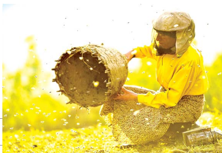
电影《蜂蜜之地》剧照

寂静被打破了。一对夫妇，七个孩子，浩浩荡荡开着车赶着牛群来了，空旷的山里忽然热闹起来，似乎充满“生机”。哈提兹古道热