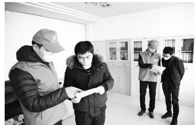
菏泽煤电彭庄煤矿：战“疫”路上青春飞扬

烟台供电公司认真贯彻落实“抗疫情、保供电、为人民”十项护航举措，积极推广全面“网上国网”APP，推行网上办电服务，推动供电服务事项“网上办、掌上办、指尖办”。针对全市企业复工复产情况，制订“一企一策”供电服务保障方案，主动开通防疫用电绿色通道，优先确保企业用电。截至目前，烟台供电公司已累计完成36家重点企业安全用电检查工作，协助客户消除安全隐患8处，主动为客户提供技术支持和业务指导，提高客户安全用电意识。