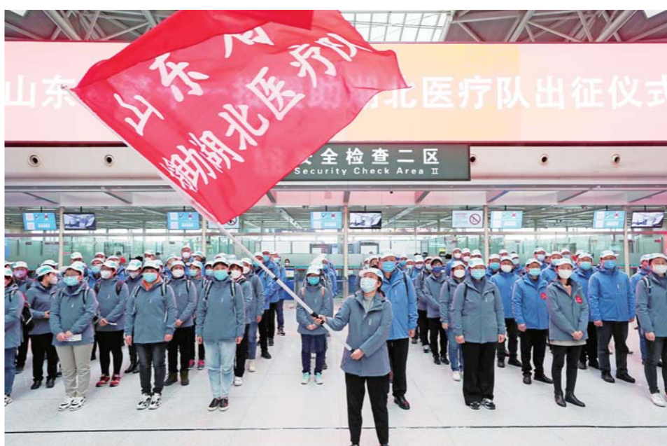
2月15日,山东省援助湖北医疗队从济南遥墙国际机场集合出发,前往湖北黄冈支援疫情防控和救治工作。

“中方行动速度之快,规模之大,世所罕见。这是中国制度的优势,有关经验值得其他国家借鉴,相信中国采取的措施将有效控制并最终战胜疫情。”世界卫生组织总干事谭德