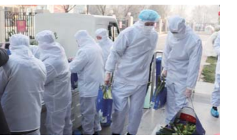
▲儒辰集团为业主免费配送新鲜蔬菜