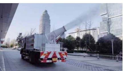
▲儒辰集团对所辖项目使用雾炮进行大面积消杀