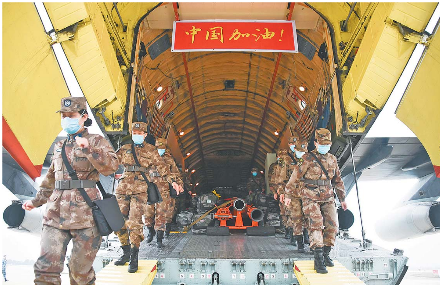
2月2日，空军出动8架大型运输机空运军队支援湖北医疗队抵达武汉天河机场。

2日凌晨1时30分，中部战区空军航空兵某师8架大型运输机，先后从某军用机场冒雨起飞，凌晨4时开始分别抵达沈阳桃仙机场、兰州中川机场、广州白云机场、南京禄口机场。在上述4地完成医疗人员和物资装载之后，8架大型运输机再次升空飞赴武汉。上午8时55分开始，8架大型运输机每隔5分钟依次降落在武汉天河机场。