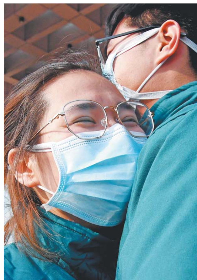
□新华社记者 李安 报道