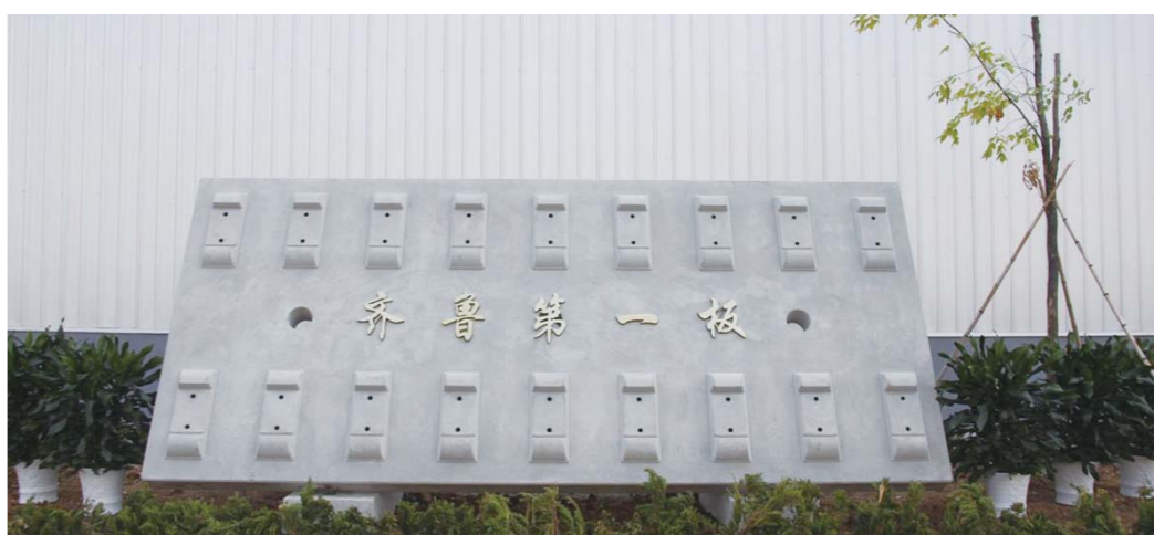
△山东高速集团生产的CRTSIII型高铁轨道板