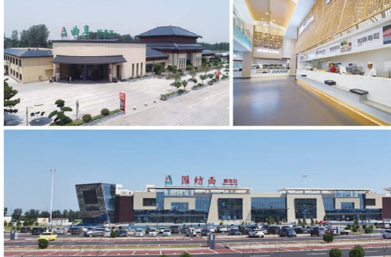
△山东高速集团落实以人民为中心的发展思想和以客户为中心的经营意识,大力推进高速公路服务区提升改造

模式创新,破解高速公路建设难题。针对之前独资建设高速公路带来的资金、征迁压力以及其他问题,集团按照“共建共享”理念,探索形成与地方政府共同出资组建项目公司推进项目建设的模式,调动了地方参与高速公路建设的积极性。2019年,集团先后与济宁市、潍坊市签署协议,共建济南至微山高速公路济宁新机场至枣菏高速段项目、潍日高速潍坊连接线项目,成为新模式首批落地项目。