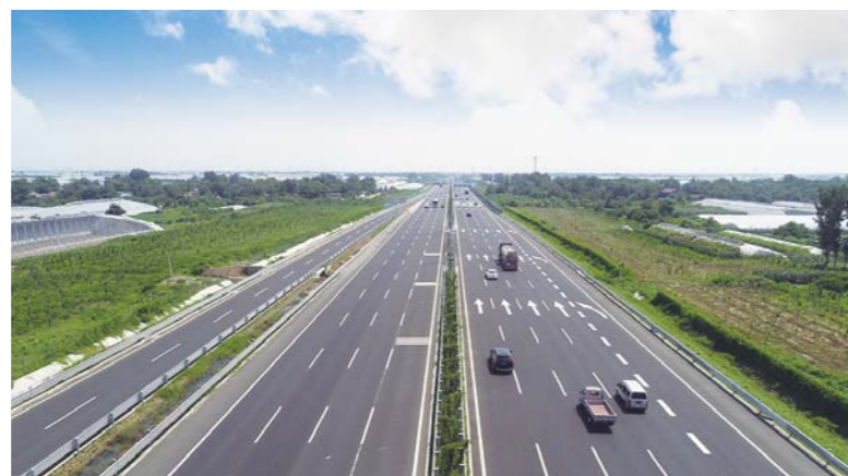
△2019年7月26日,由山东高速集团投资建设的济青高速改扩建工程建成通车,山东自此拥有了第一条八车道高速公路

科技创新,点燃高质量发展引擎。2019年以来,集团密集出台各项举措,激发创造活力,涌现出一大批优秀科技成果:获得中国公路学会等部级学会奖励20项,参建项目获“李春奖”3项,“国家优质工程金奖”2项;授权