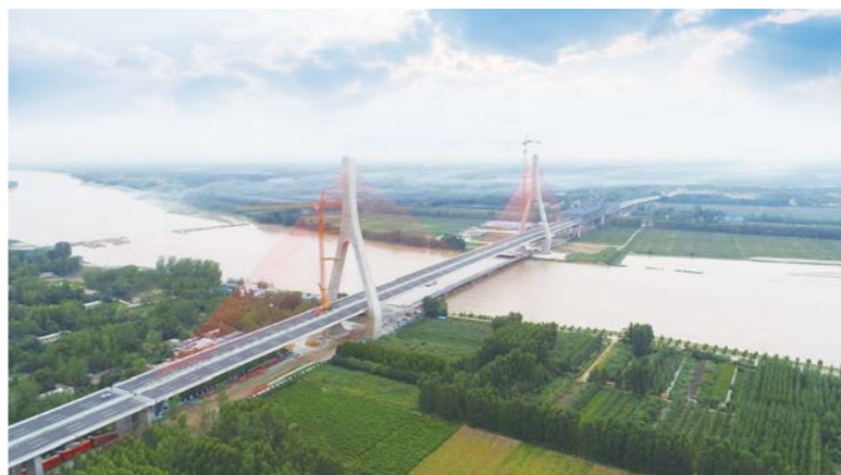
△2019年10月16日,由山东高速集团投资建设的国高青兰线泰安至东阿段全线通车,建成黄河上最大跨径钢混组合梁斜拉桥

专利98项,省部级工法14项,行业标准1项,地方标准3项;以山东高速集团为依托单位的公路交通节能环保技术及装备交通运输行业研发中心(济南)荣获2019年度交通运输行业重点科研平台十大“创新平台”称号。在主业相关重大装备研发方面取得的成绩尤为亮眼:自主研发的2.0版沥青路面就地热再生机组拥有自主知识产权和16项国家专利,可以在废旧沥青100%利用前提下,实现对各类路面病害的快速修复,与同类产品相比提高生产效率20%,节省燃料成本30%;研发的CRTSIII型高铁轨道板机组流水线装备自投产以来完成产值8.9亿元,省内市场占有率达100%。