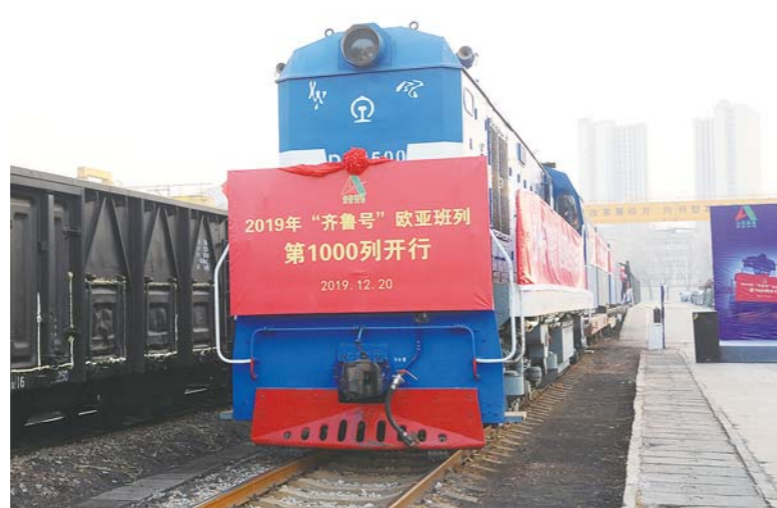
△2019年12月20日,由山东高速集团统筹运营的“齐鲁号”欧亚班列开行当年第1000列

专利98项,省部级工法14项,行业标准1项,地方标准3项;以山东高速集团为依托单位的公路交通节能环保技术及装备交通运输行业研发中心(济南)荣获2019年度交通运输行业重点科研平台十大“创新平台”称号。在主业相关重大装备研发方面取得的成绩尤为亮眼:自主研发的2.0版沥青路面就地热再生机组拥有自主知识产权和16项国家专利,可以在废旧沥青100%利用前提下,实现对各类路面病害的快速修复,与同类产品相比提高生产效率20%,节省燃料成本30%;研发的CRTSIII型高铁轨道板机组流水线装备自投产以来完成产值8.9亿元,省内市场占有率达100%。