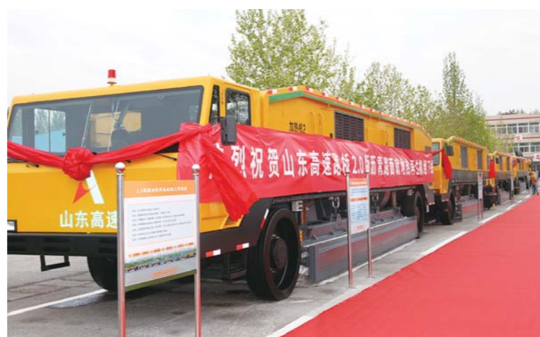
△山东高速集团自主研发的2.0版沥青路面就地热再生机组