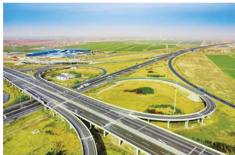
△2019年11月30日,由山东高速集团投资建设的长深高速高青至广饶段建成通车