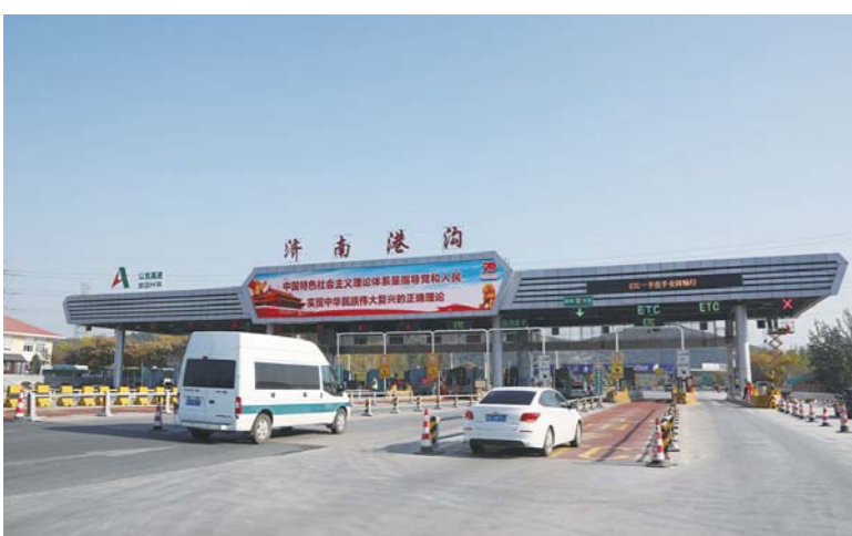
△山东高速集团取消省界收费站各项工作实现“省内率先、国内领先”,ETC发行量稳居全国第一

初心如炬,使命如山。2020年是全面建成小康社会和“十三五”规划收官之年,也是我省新旧动能转换“三年初见成效”之年,山东高速集团将坚定不移贯彻落实省委、省政府部署要求,坚定不移聚焦主责主业,加快推进高速公路重点项目建设,坚定不移聚焦高质量发展,实现“营业收入过千亿、利润总额破百亿”目标,努力在我省经济社会发展中有更大担当、更大作为,努力为全面开创新时代现代化强省建设新局面作出更大贡献。