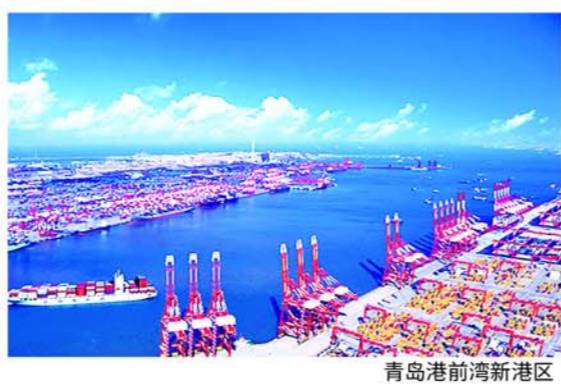
青岛港前湾新港区