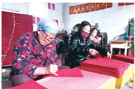
▲青州民间艺人手工制作过门笺

早在汉代，古人每逢立春日，都要到郊外迎春，立青色幡旗在城门口，以青色象征万物生长、年丰民阜之意。唐宋时，民间在门楣上贴春幡，以代青幡，并蔚然成习。宋人陈元靓《岁时广记》引《皇朝岁时杂记》云：“元旦以青纸或青绢剪四十九幡，围一大幡，或以