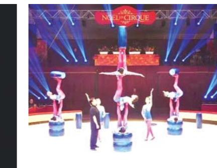
本组图片为泰山杂技团演出时的资料照片