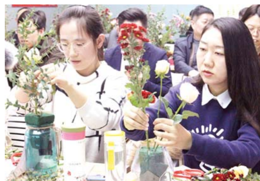
□记者 李剑桥 通讯员 李荣新 报道

界的艺术。特别是中国杂技艺术，拥有几千年的历史，源远流长。我们山东又是全国的杂技大省，作为文化使者和友谊的桥梁，我们通过杂技表演，让国外的观众更深刻地了解中国的传统杂技艺术，更好地了解中国。作为文艺工作者，我们也要更好地推广‘好客山东’，推广齐鲁文化和泰山文化。”邱建说。