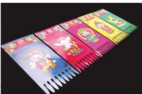
▲机器生产的新式过门笺