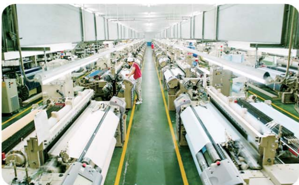
▲鲁泰纺织现代化织布车间