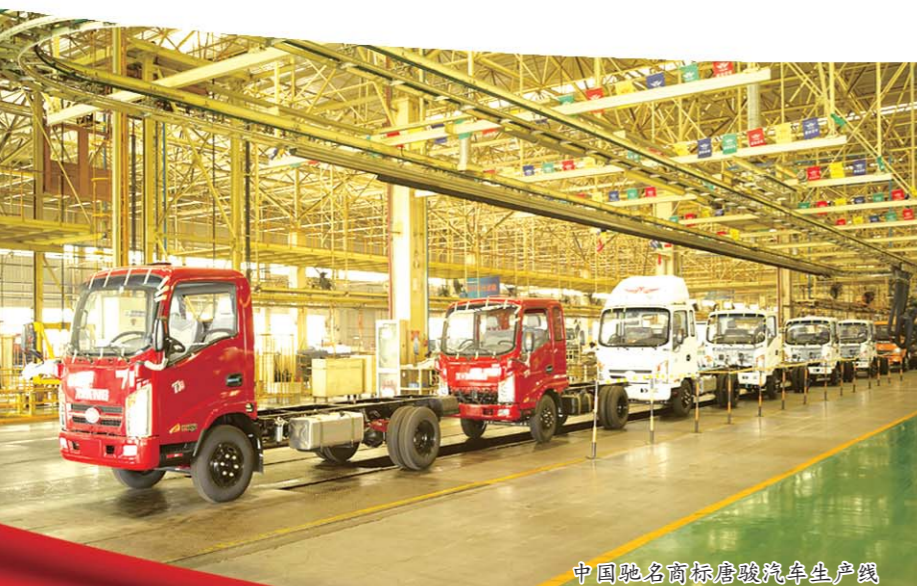
中国驰名商标骏骏汽车生产线