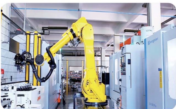
▲省级“隐形冠军”企业山东泰展机电科技股份有限公司的智能车间