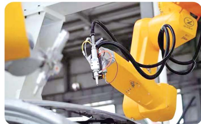
▲山东镭泽科技激光切割机器人