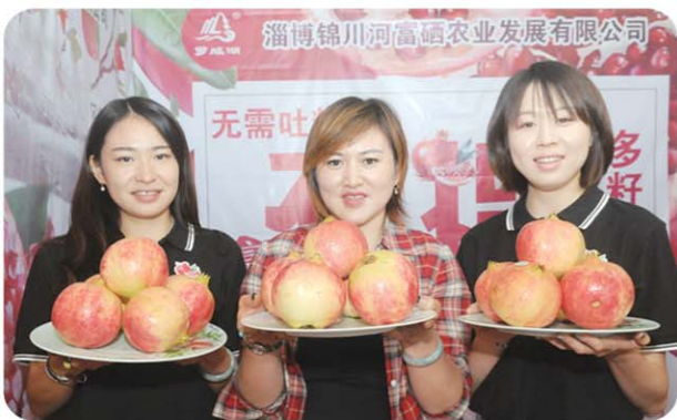
▲富硒农业、长寿淄川成为新品牌，火红的软籽石榴长成新产业