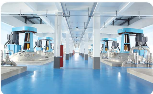
▲山东金城生物医药产业园一角