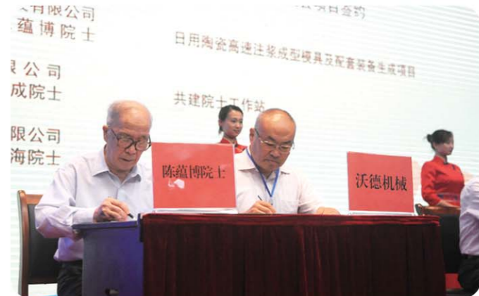
▲百名专家淄川行成为招商引资新平台