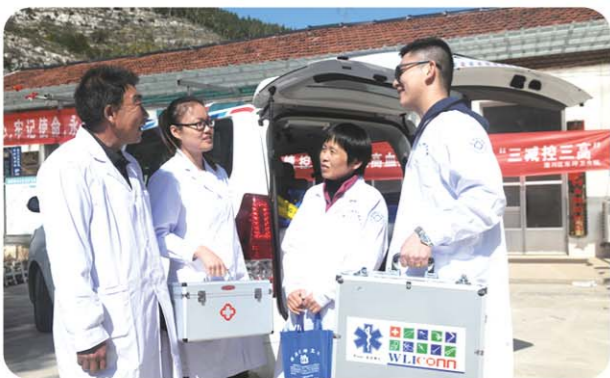
▲“行走的医生 流动的医院”把服务送到百姓家门口