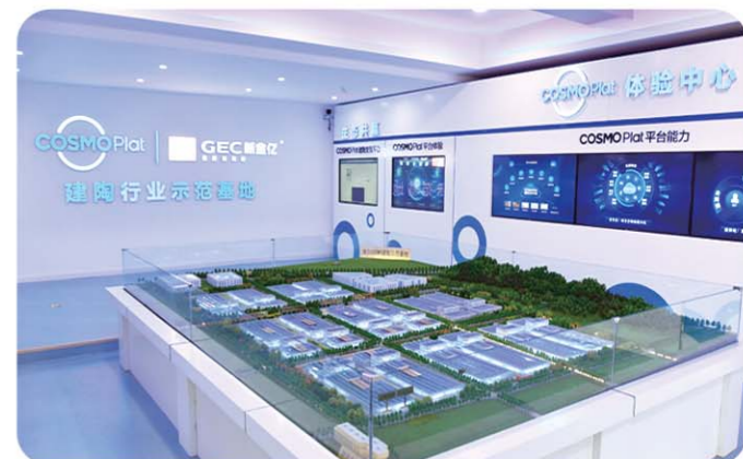
▲日日顺建陶产业园海尔用户体验中心