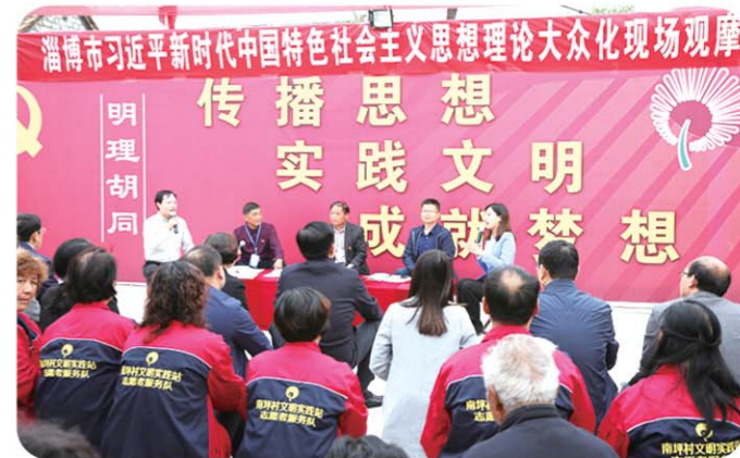
▲新时代文明实践“明理胡同”成为理论大众化宣讲站