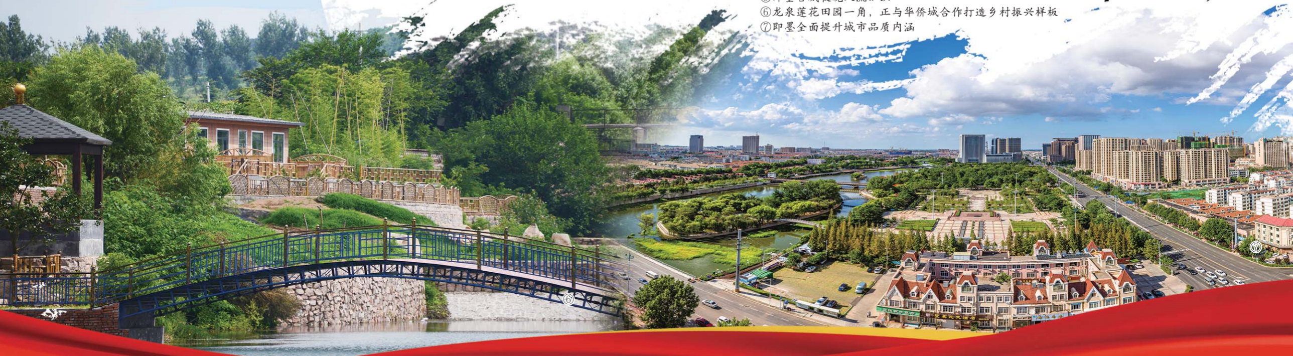
⑤即墨古城夜晚人流如织 ⑥龙泉莲花田园一角，正与华侨城合作打造乡村振兴样板 ⑦即墨全面提升城市品质内涵