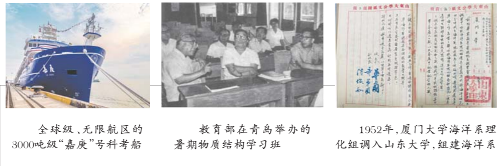
全球级、无限航区的3000吨级“嘉庚”号科考船