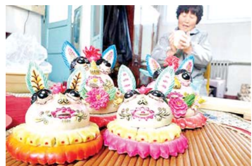
胶东花饽饽