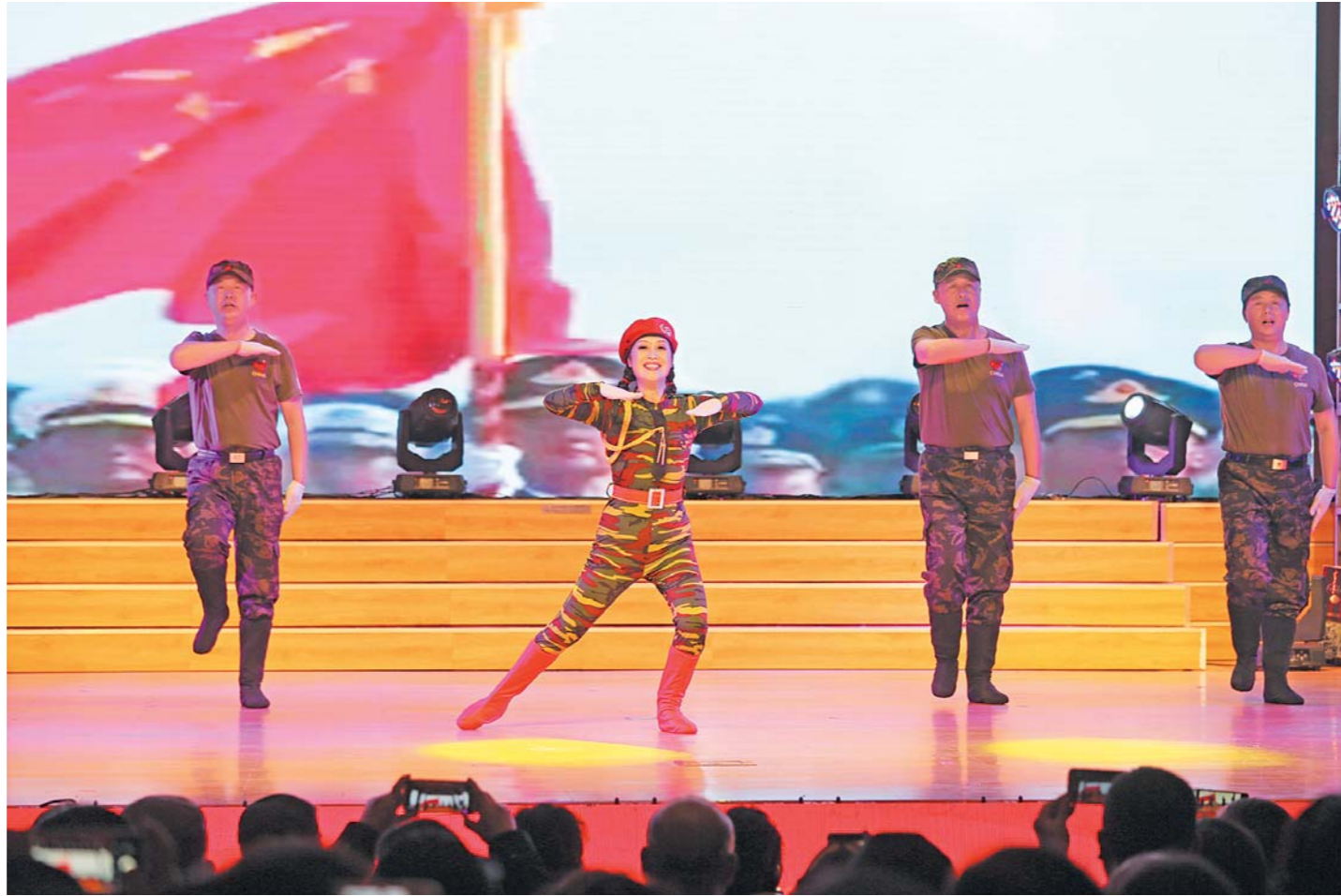
□ 记者 薄克国 报道