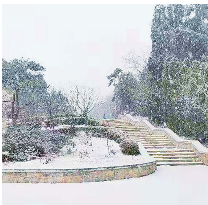
□大众报业记者 张晓燕 报道

瑞雪兆丰年。1月5日,2020年济南首雪率先到达济南跑马岭景区。纷纷扬扬的雪花让大地披上洁白外衣,为新年增添了祥瑞之气。