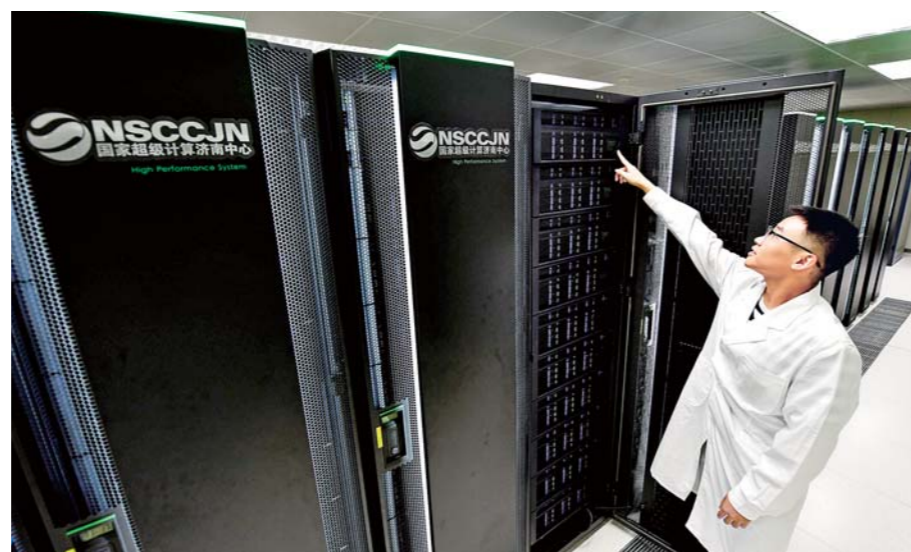
在国家超级计算济南中心,工作人员在查看存储设备运转情况。(□资料图)

“龙头”带动,在“血脉”,在“筋骨”,在于浑然一体又高人一头。济南正以冲锋陷阵、打开局面的“先行者”“改革者”姿态,搭建起服务全省开放发展的大平台,为新时代现代化强省建设注入具有深远影响的新动能。