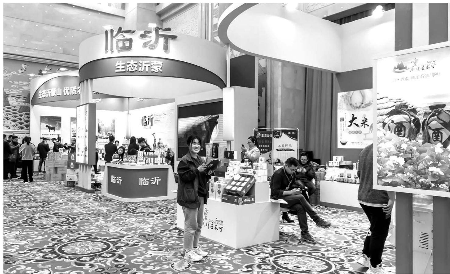
12月16日至18日,优品嘉年华——东西扶贫协作农产品产销对接会在济南山东大厦举行,来自省内外90余家企业360余种农产品汇聚于此,特别是来自临沂的农产品受到与会者的青睐。据介绍,临沂在强力推进优质农产品基地品牌建设的同时,抓认证、抓检测、抓追溯,一品一码,保证了农产品无公害、无农残。图为对接会上的临沂展区。

青岛市市场监管局相关负责人透露,此次抽检反映出的主要问题是农药兽药残留超标和复用餐具卫生不达标的问题,主要表现在复用餐具中检出大肠菌群、阴离子合成洗涤剂超标;熟肉制品、烧烤肉制品中超标范围、超限量使用食品添加剂,涉及山梨酸及其钾盐、亚硝酸盐2项;水果中检出农残超标,具体为香蕉中的吡唑醚菌酯超标。