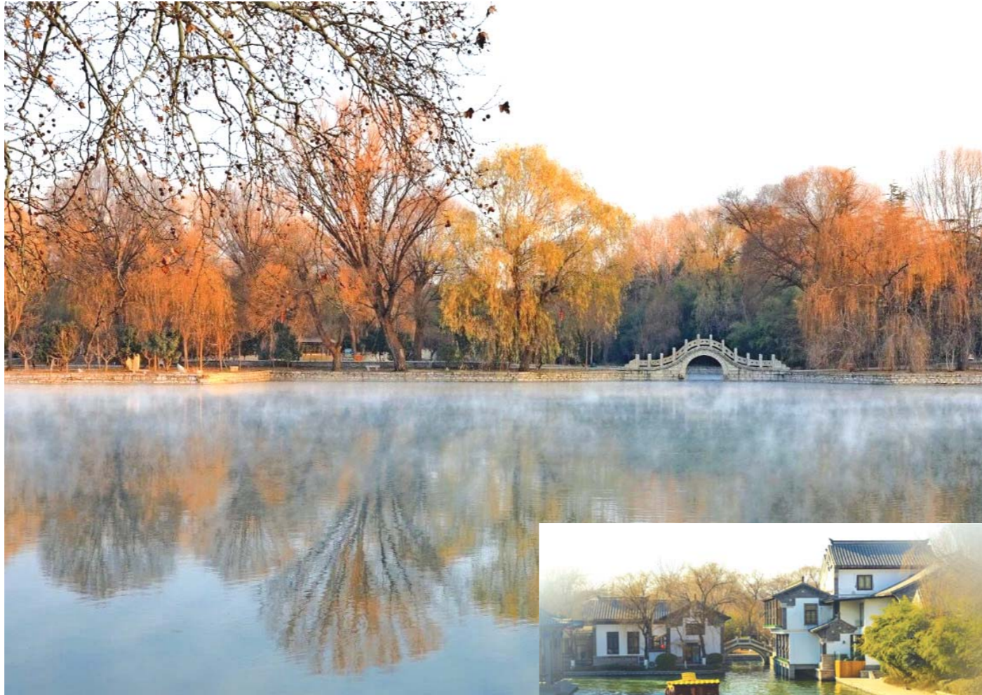
▲ 临朐老龙湾景区初冬美景 ▲ 泉城护城河畔景色如画