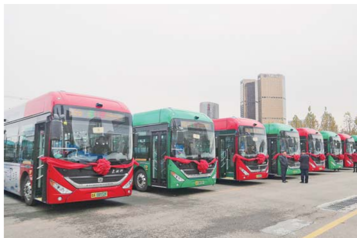
济南首批10辆氢能源燃料电池公交车投入运营。

本报济南11月24日讯 今天下午,随着首批10辆氢能源燃料电池公交车投入K115路线运营,济南市氢能源公交车示范线正式开通运行(上图)。