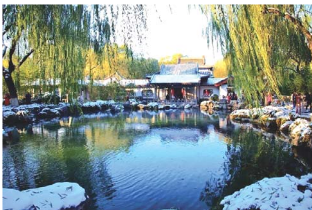
趵突泉冬日美景(资料图)