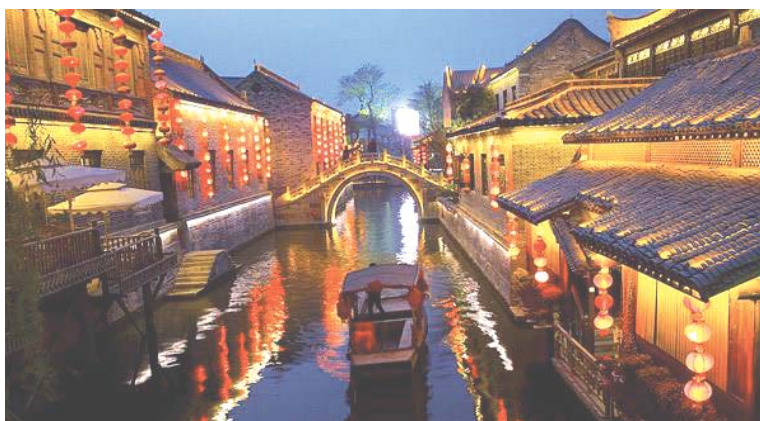
台儿庄古城(资料图)