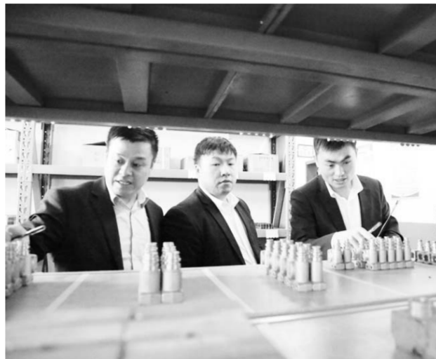
山能临矿菏泽煤电公司大力推行“7S”精益管理，着力打造简约化、标准化、规范化、流程化管理体系，以精益管理创造卓越绩效，不断提升企业管理水平。

实施创新团队管理体现了以人为本现代企业管理理念，激发了全员参与创新活力。通过坚持以人为本，转变传统模式，引导员工参与创新活动培养复合型人才，促进了人才成长。创新人才管理模式、打造柔性创新团队以来，莒县供电公司共有12名创新项目人晋岗、117人次技能等级提升，人才当量密度提升至1.0789；643人次得到晋级进档，115人次获成果奖励，3个创新工作室获上级资金资助，公司荣获“山东省管理创新优秀企业”称号。