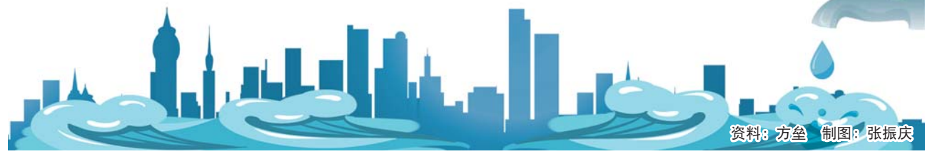
资料：方垒 制图：张振庆