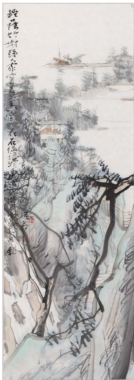
轻荫竹树 100cm × 35cm