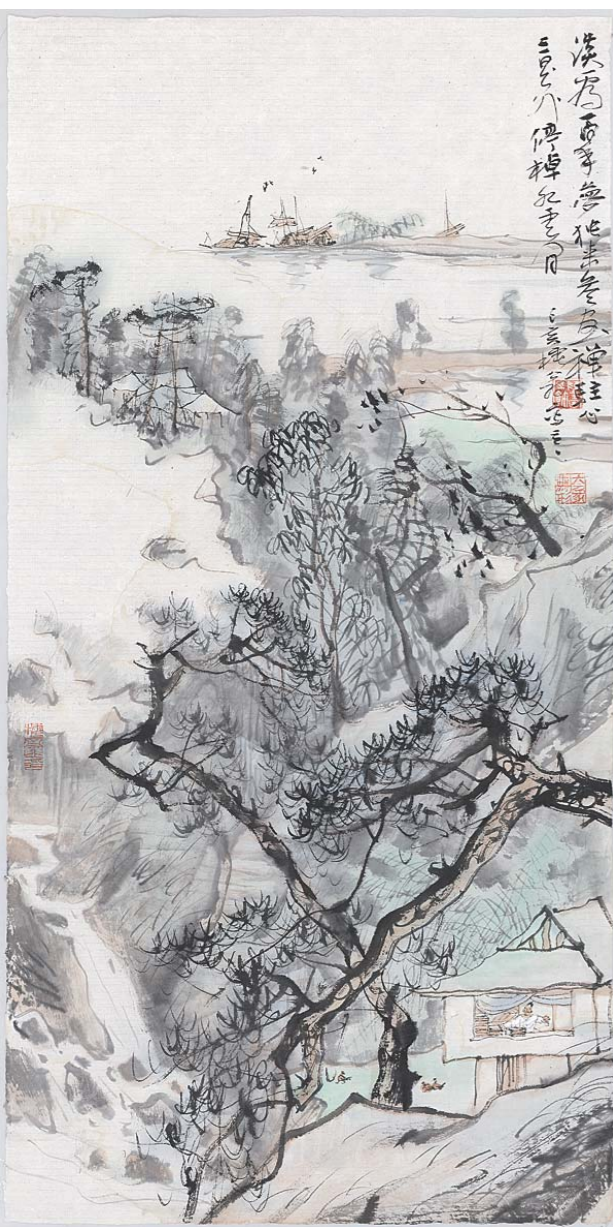
淡看百年梦 90cm × 48cm