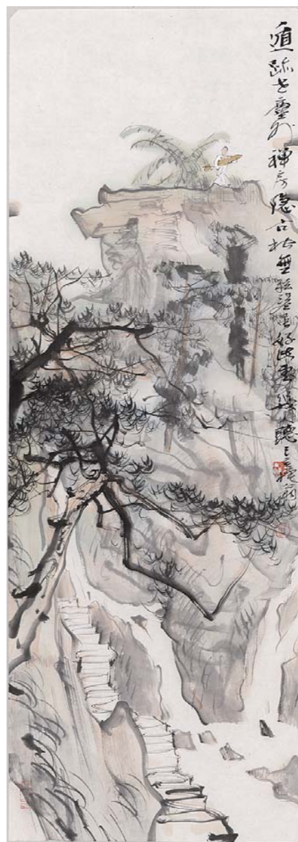
遁迹世尘外 100cm × 35cm

1946年生于济南市, 少年时为著名山水画家黑伯龙和陈维信先生门下入室弟子; 1976年任教于山东曲阜师范大学艺术系; 1980年考入广西艺术学院, 为黄独峰教授的研究室, 毕业后留院任教; 1993年起任广西艺术学院教授, 天津南开大学东方艺术系教授、硕士研究生导师。中国美术家协会会员。出版多种个人画集, 并编著有《山水画理》《国画写意四君子》《荣宝斋画谱》《陈玉圃解析唐寅》《南田画跋解读》《樗斋诗丛》等画论著作。