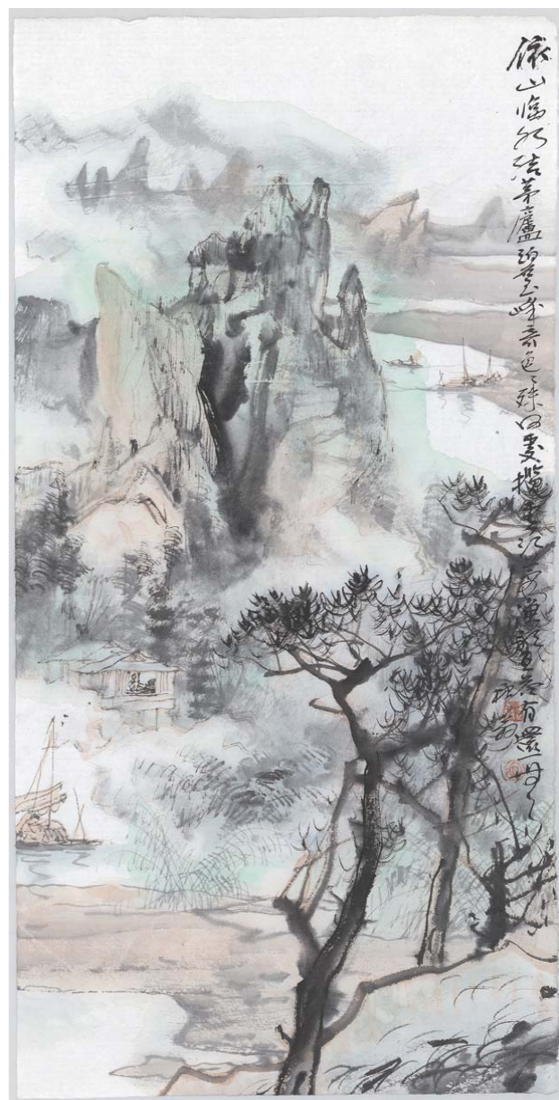
依山临水 90cm × 48cm