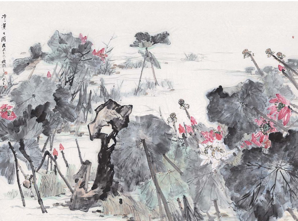
净莲之图 180cm × 250cm