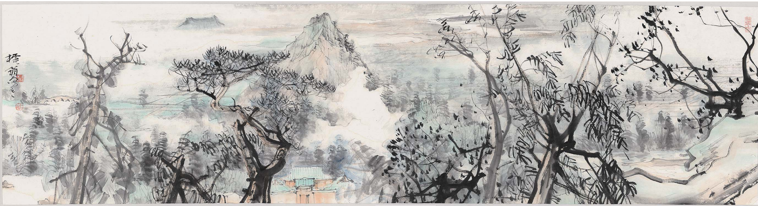
鹤华春色 48cm × 180cm