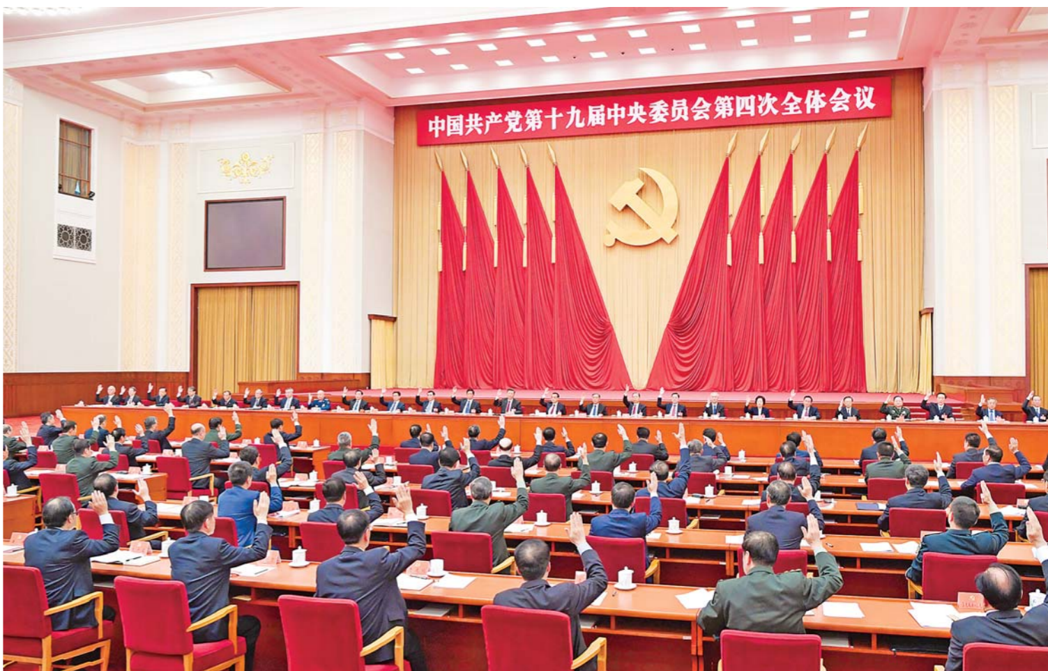
中国共产党第十九届中央委员会第四次全体会议,于2019年10月28日至31日在北京举行。中央委员会总书记习近平作重要讲话。