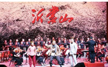
民族歌剧《沂蒙山》剧照

一部参演民族歌剧，民族歌剧《沂蒙山》将在上汽·上海文化广场上演。今天下午，我省在上海召开新闻发布会，介绍歌剧《沂蒙山》的创作和演出情况，国内多家媒体到场。