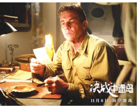
好莱坞战争片《决战中途岛》剧照