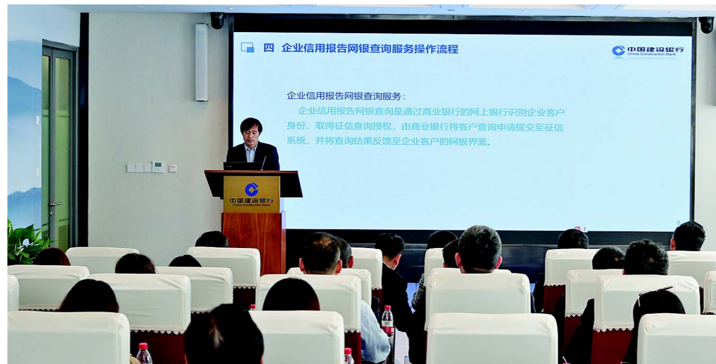
建行工作人员介绍如何通过企业网银查询企业信用报告。

本报济南讯 10月22日上午，人民银行济南分行与建设银行山东省分行在济南举办“企业信用报告网银查询服务推介会”。10时左右，随着客户现场成功将企业信用报告打印出来，建行山东省分行企业网银客户信用报告查询功能正式上线。 记者了解到，企业信用报告对外查询是人民银行的一项重要窗口服务。目前，人民银行主要通过柜台现场提供企业信用报告查询服务。随着互联网、大数据技术的发展及个人信用报告互联网查询和自助查询的广泛应用，企业对信用报告便捷化查询的需求越来越迫切。