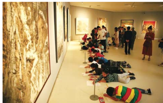
孩子们在展厅临摹