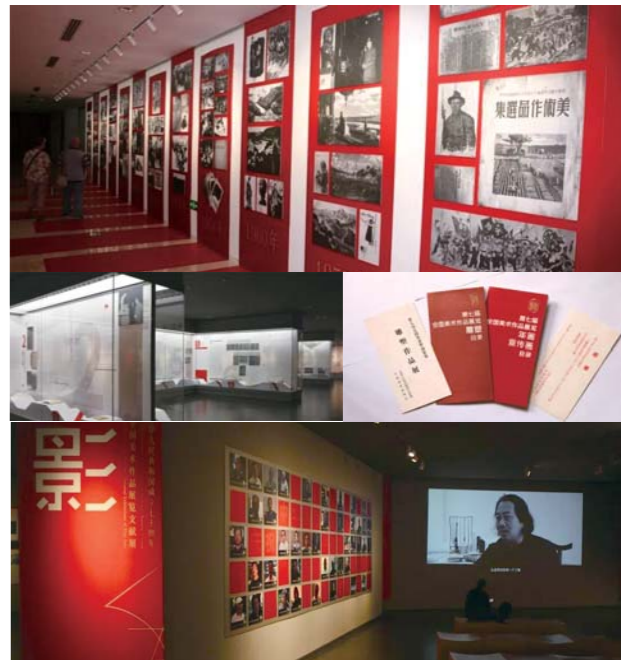
“溯源——历届全国美术作品展览文献展”现场