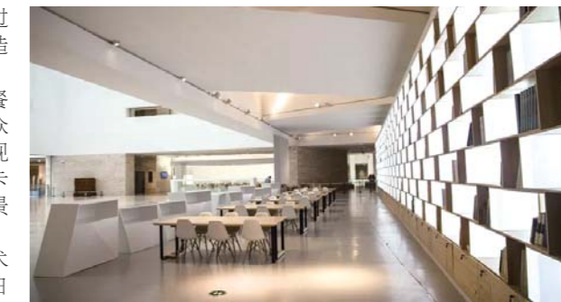
美术馆内的阅读体验区