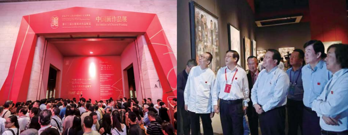
展览开幕式盛大、庄严，现场嘉宾云集

9月26日上午10:30，“第十三届全国美术作品展览中国画展”在山东美术馆隆重开幕。各级领导嘉宾、专家学者、老艺术家代表和参展作者代表、中央及省市媒体代表等千余人出席开幕式。