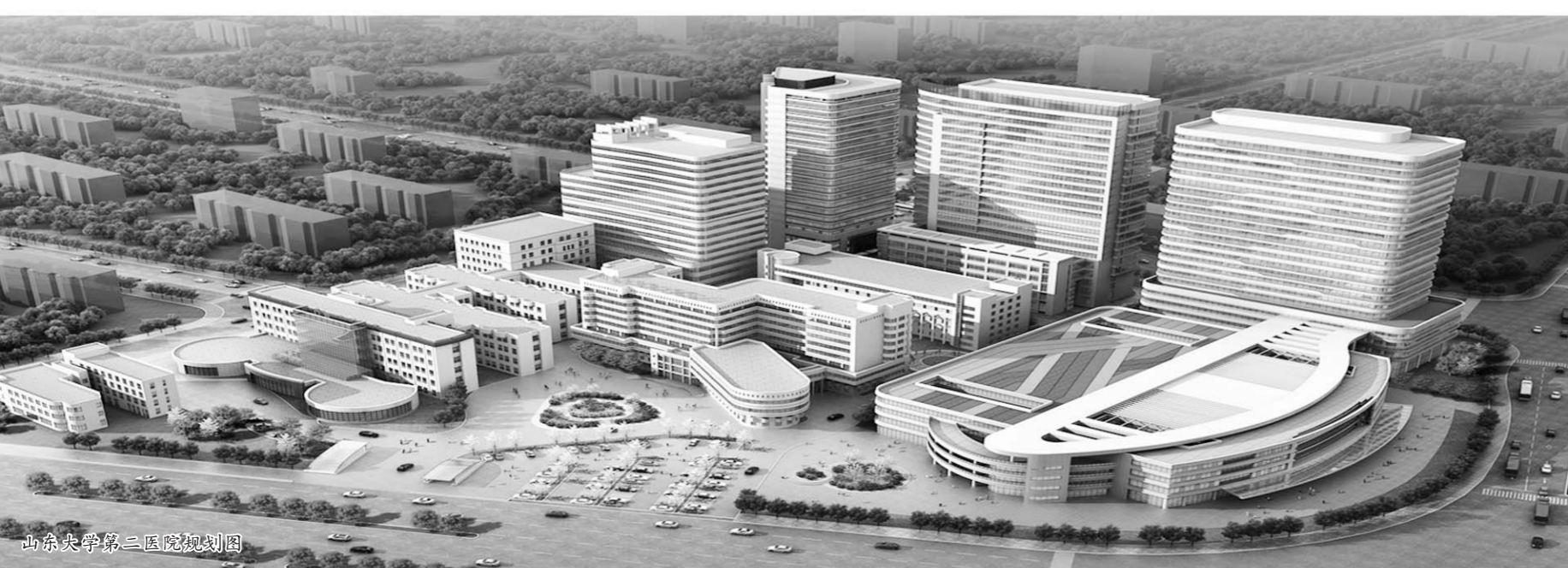
山东大学第二医院规划图