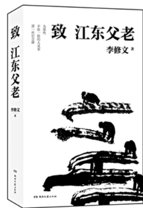
《致江东父老》 李修文 著 湖南文艺出版社

历史记住的，总是大人物。我们看到英雄，很少看到匍匐的人群，我们看到光鲜，很少留意灰暗，《致江东父老》为不值一提的人或事，建起了一座纪念碑。