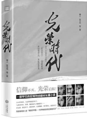
《光荣时代》 魏人 张卫华 等著 天地出版社

在放纵与克制之间，酒在不同的社会中究竟落在哪个位置？本书是一本酒文化主题的游记，对东西方之间根深蒂固的文化冲突，以及饮酒给当今世界带来的惊人影响力提出了一些令人兴奋的见解。