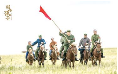
电视剧《国家孩子》剧照