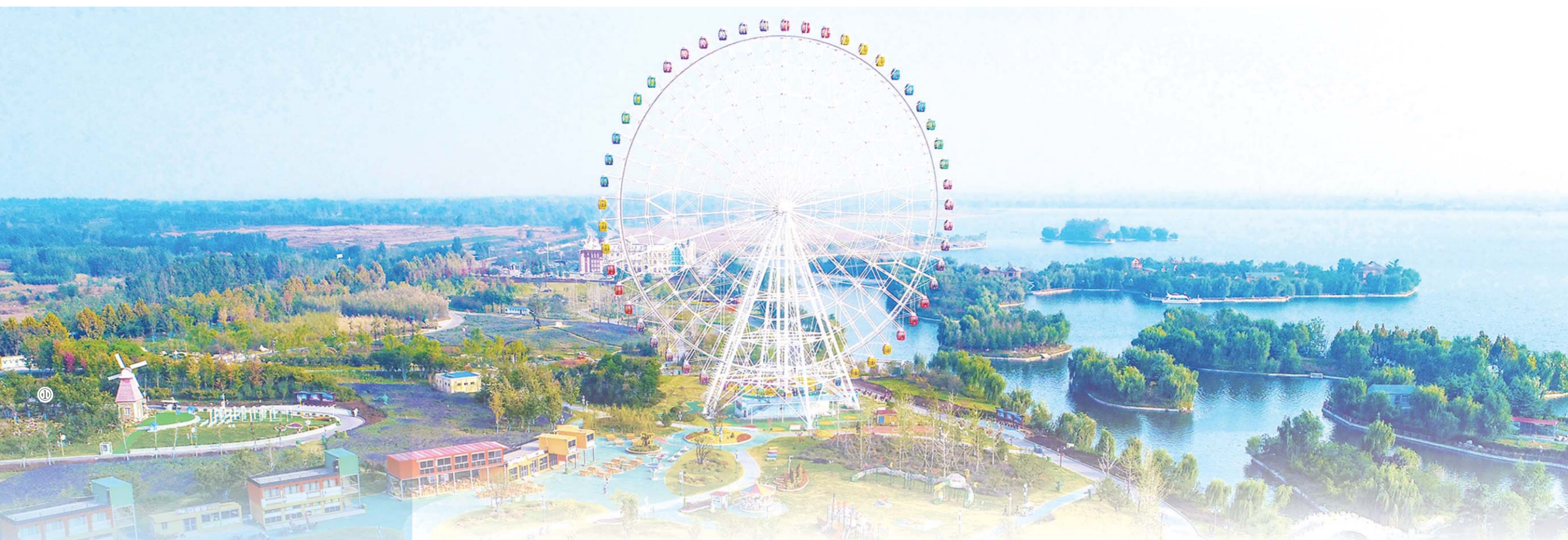
投资166.37亿元，打造山水林田湖草生态保护修复工程