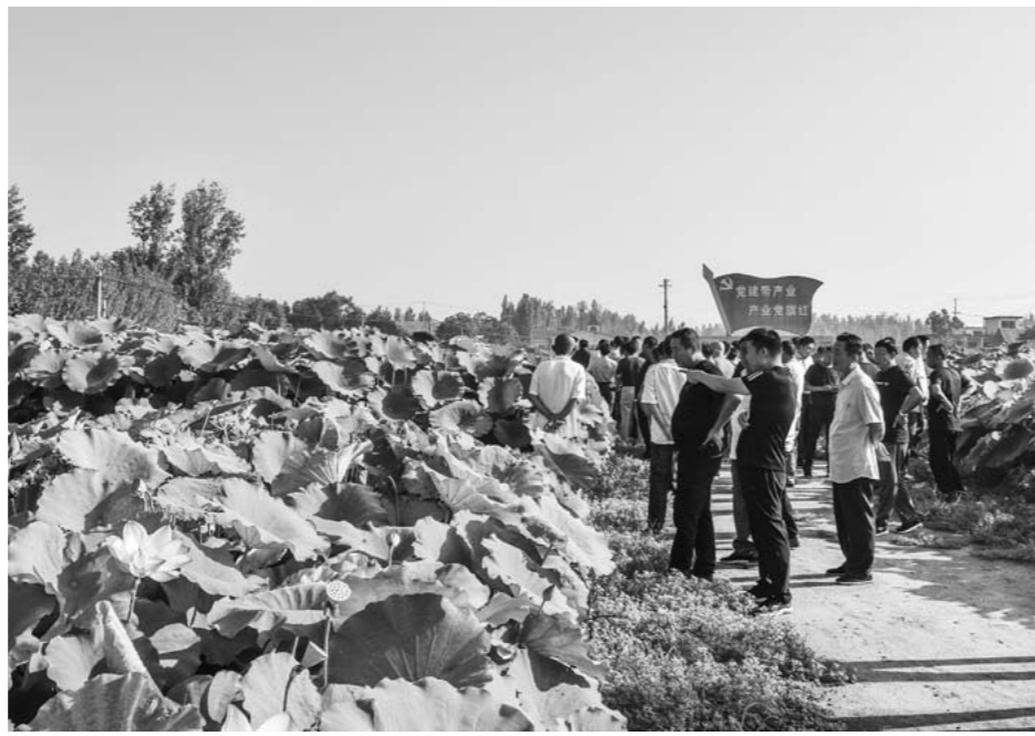
□孟一 美国乐 报道

8月20日，4辆大巴车载着曲阜市姚村镇的54名村支书挨个村地转，从全市先进村里选出“书记顾问”，现场给其他村支书点拨发展道路。