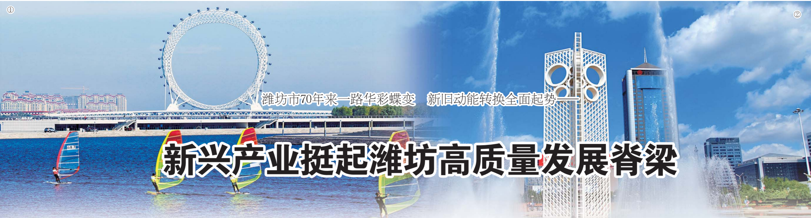
潍坊市70年来一路华彩蝶变 新旧动能转换全面起势