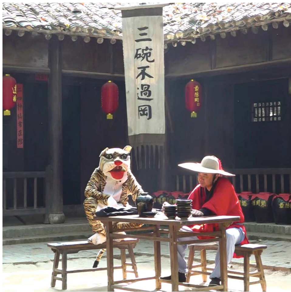
景阳冈景区内正在上演历史情景剧。

悠久的历史使聊城具有浓厚的文化氛围,为推动文旅融合,聊城努力挖掘新的旅游消费增长点。在中华水上古城内,“博物馆”成了最常见的字眼,古城内分布着契约博物馆、婚俗博物馆、乡村记忆博物馆、老