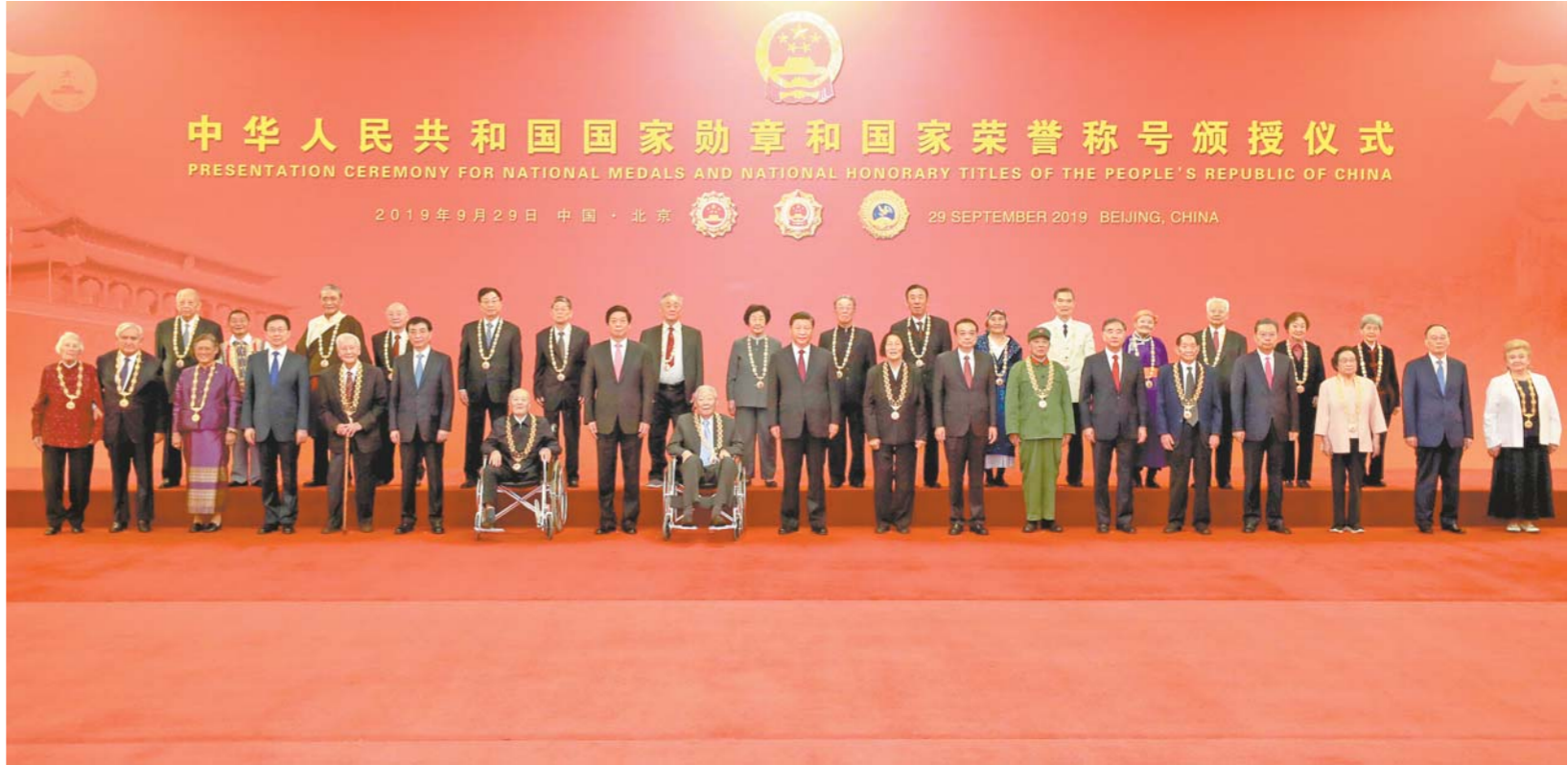
9月29日,中华人民共和国国家勋章和国家荣誉称号颁授仪式在北京人民大会堂金色大厅隆重举行。习近平等党和国家领导人同国家勋章和国家荣誉称号获得者合影。

新华社北京9月29日电 中华人民共和国国家勋章和国家荣誉称号颁授仪式29日上午在北京人民大会堂金色大厅隆重举行。中共中央总书记、国家主席、中央军委主席习近平向国家勋章和国家荣誉称号获得者颁授勋章奖章并发表重要讲话。习近平强调,崇尚英雄才会产生英雄,争做英雄才能英雄辈出。英雄模范们用行动再次证明,伟大出自平凡,平凡造就伟大。只要有坚定的理想信念、不懈的奋斗精神,脚踏实地把每件平凡的事做好,一切平凡的人都可以获得不平凡的人生,一切平凡的工作都可以创造不平凡的成就。