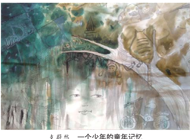
支蔚然 一个少年的童年记忆