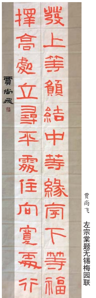
左宗棠题无锡梅园联