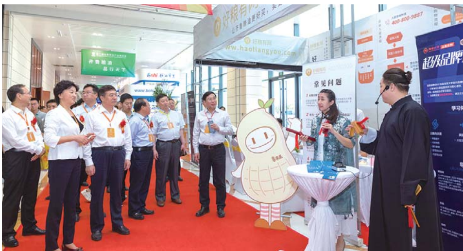
△“好粮有网”亮相粮博会，现场采用山东快板的活泼形式进行推介，吸引了参会领导及代表驻足观看并了解平台建设情况

9月19日—21日，第二届山东粮油产业博览会在德州举行，来自全省16市的299家粮油企业集中展示山东粮油产业的强大阵容的同时，也向世人彰显了“齐鲁粮油”品牌建设的辉煌成果。大会共收到上报签约项目105个，签约合同意向资金38.7亿元，涵盖招商合作、贸易合作、人才引进、科技成果转化、产学研合作五大类。 本届粮博会由山东省粮食和物资储备局、德州市人民政府共同主办，德州市发展和改革委员会承办，中国粮食研究培训中心、山东省粮食行业协会支持。博览会以“新时代、大产业、强品牌、促发展”为主题，分为山东粮油产业博览会，加快推进粮食产业创新发展报告会，项目推介及成果签约仪式以及“齐鲁粮油”花样面点大赛决赛四部分。