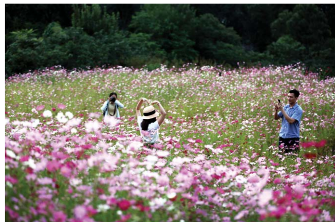
年轻人到此少不了拍照留念。