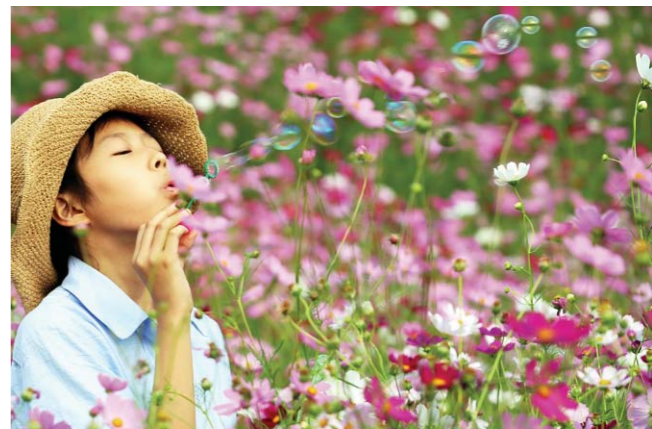
小朋友游兴正浓，吹起了“肥皂泡”。