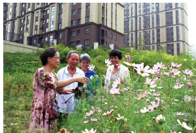
在子女的陪伴下，老人们也前来赏花。