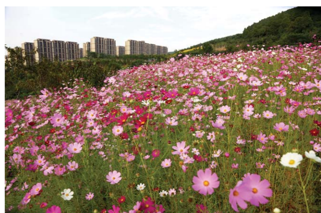
附近的居民住宅小区俨然成了花园洋房。