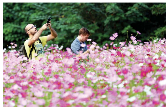
几名在济南的外国人也慕名而来。