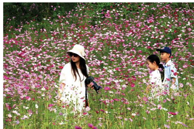
游人游走于花海之中，尽情享受盛开的花朵带来的愉悦。