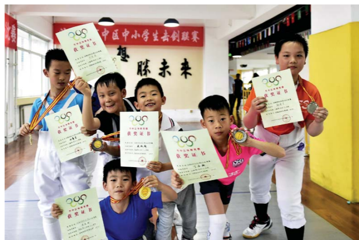
收获的不仅仅是荣誉，更重要的是内心的锤炼。