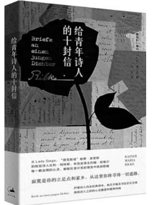
《给青年诗人的十封信》 【奥地利】莱内·马利亚·里尔克 著 上海人民出版社

真正的诸葛亮到底是怎样的一位人物？诸葛亮的一生究竟是输还是赢？作者以“策略规划”的现代视角，在叙述诸葛亮行为经历的同时，深度剖析蕴含其中的经营和管理智慧。对现代企业经营具有极强的启发和借鉴意义。