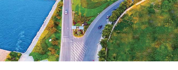
①蒙山层峦叠嶂 ②沂蒙情雕塑 ③孟良崮战役纪念馆 ④沂蒙革命纪念馆内场景 ⑤火线路桥场景 ⑥学织布 ⑦大学生在认真听取关于沂蒙精神的讲解 ⑧大气磅礴、风景如画的临沂城