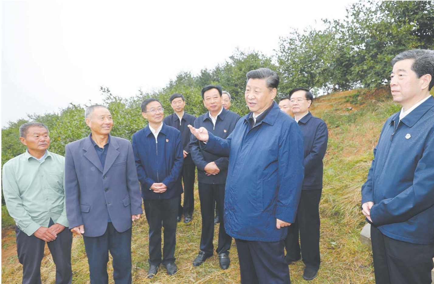
9月16日至18日, 中共中央总书记、国家主席、中央军委主席习近平在河南考察。这是17日上午, 习近平来到信阳市光山槐店乡司马光油茶园, 同正在劳作的村民和管理人员交流。

新华社郑州9月18日电 中共中央总书记、国家主席、中央军委主席习近平近日在河南考察时强调, 要认真贯彻落实党中央决策部署, 坚持稳中求进工作总基调, 坚持新发展理念, 统筹做好稳增长、促改革、调结构、惠民生、防风险、保稳定各项工作, 打好三大攻坚战, 促进经济持续健康发展和社会和谐稳定, 不断增强人民群众获得感、幸福感、安全感, 在中部地区崛起中奋勇争先, 谱写新时代中原更加出彩的绚丽篇章。