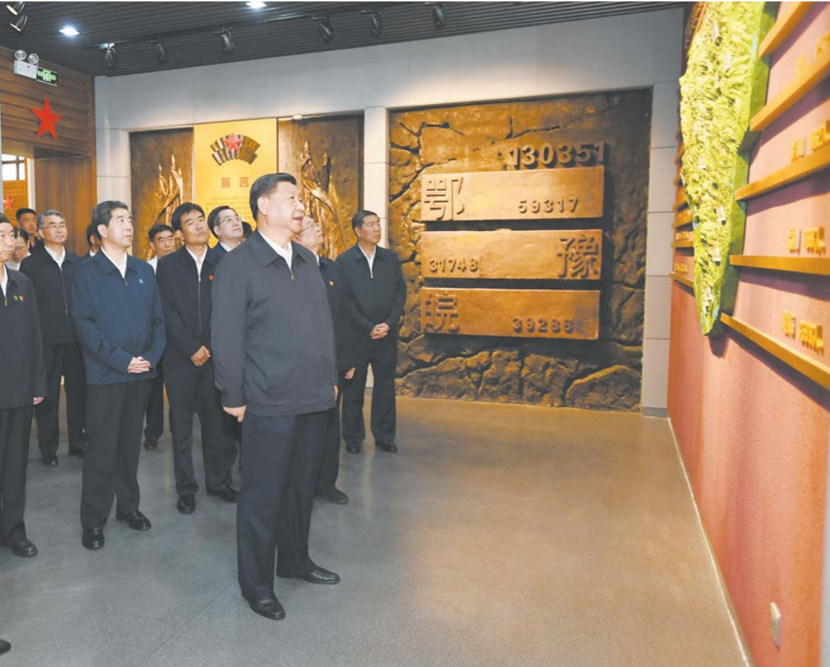
9月16日至18日, 中共中央总书记、国家主席、中央军委主席习近平在河南考察。这是16日下午, 习近平来到位于信阳市新县的鄂豫皖苏区首府烈士陵园, 瞻仰革命烈士纪念馆。

强调开展“不忘初心、牢记使命”主题教育, 党员、干部要多学党史、新中国史, 自觉接受红色传统教育