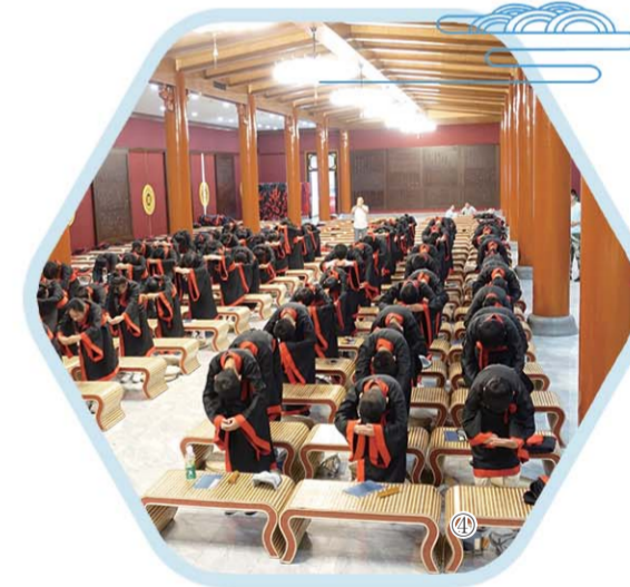
①师生合唱团 ②素质训练 ③留下重温经典的瞬间 ④恭敬行下拜师礼 ⑤校园一角