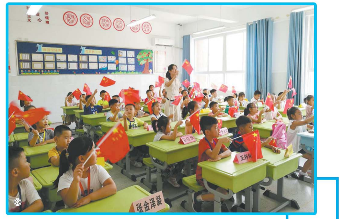
③开学第一课——爱国主义教育

“办最好的教育！”代表着教育发展的方向、目标，代表着教育工作者至诚的梦想、追求，代表着教育部门对社会各界至善的责任、承诺。何谓“最好的教育”？苏联教育家苏霍姆林斯基曾说过：“学校教育的理想是培养全面和谐发展的人，社会进步的积极参与者。培养全面发展的、和谐的个性的过程就在于：教育者在关心人的每一个方面、特征的完