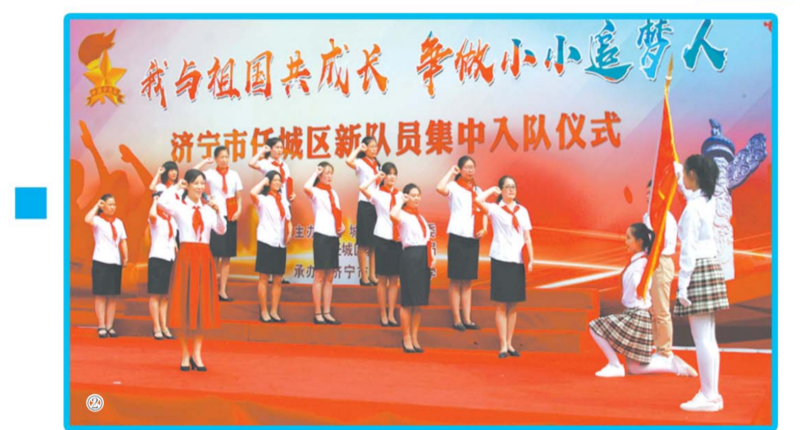
②一年级新聘任中队辅导员宣誓