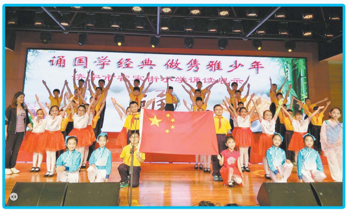
①霍家街小学经典诵读展示活动