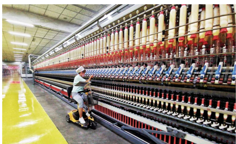
8月22日,在疏勒县如意科技纺织有限公司紧密纺细纱车间里,维吾尔族女值车工开着智能电动车,根据pad显示的断头信息,合理规划巡回路线,大大提高了挡车的效率。