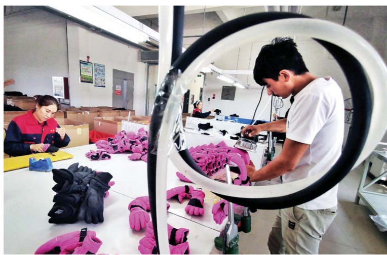
喀什中兴手套有限公司车间内,维吾尔族女工们正在对出口滑雪手套进行整形。