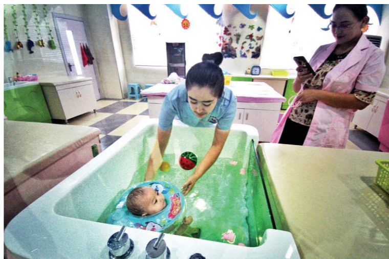
在日照市援建的麦盖提县(日照)妇幼保健院里,当地婴儿在儿童洗浴中心游泳。