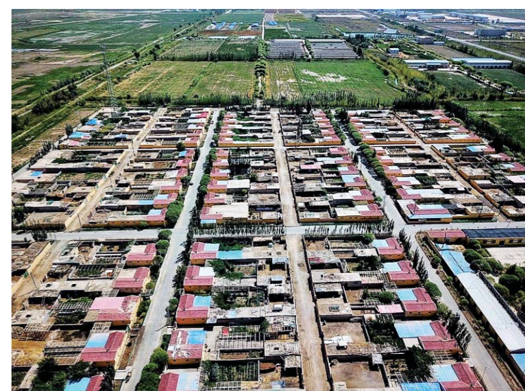
新疆五征绿色农业发展有限公司走出了山东产业援疆村企共建新路子,他们与麦盖提县喀克夏勒村达成协议,村民把原有的宅基地自愿流转给五征公司,企业投资500万元,在巴莎公路边新建151户高标准安居富民房,对园区内的喀克夏勒村实施了整体搬迁。从土坯房搬进安居房,村民们都乐开了花。