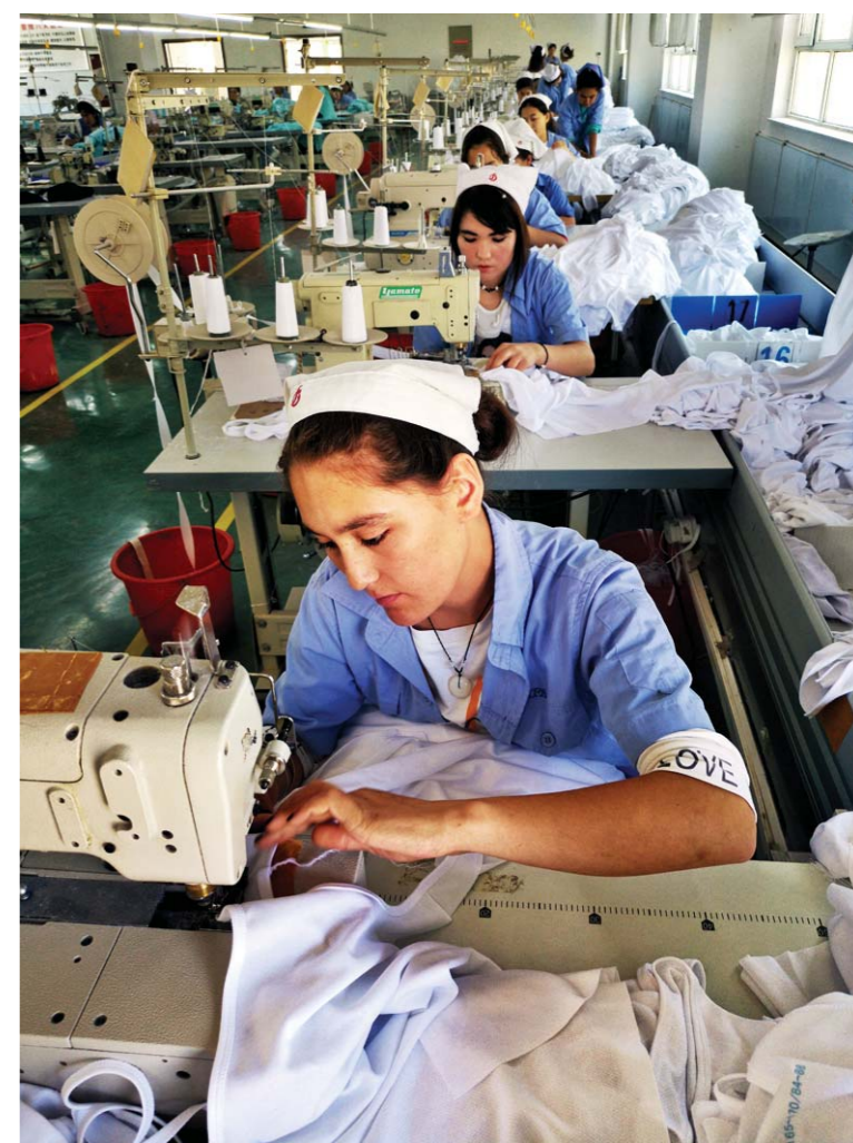
新疆即发华和服装有限公司缝纫车间内,维吾尔族女工正在工作。