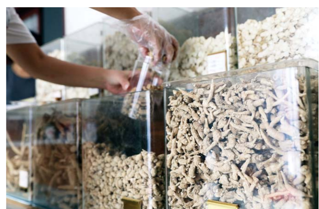
随着种植、加工业的发展，西洋参产品种类越来越丰富。