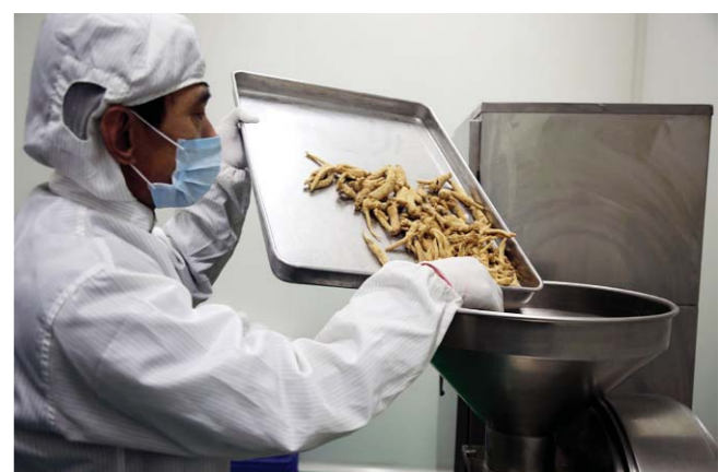
工人正将经过挑选的西洋参送入加工生产线。