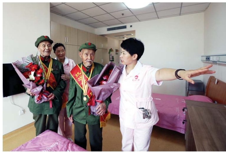
护理人员搀扶两名抗战老兵来到他们在“功臣楼”的新房间，为他们介绍房间的各种电器、设施。