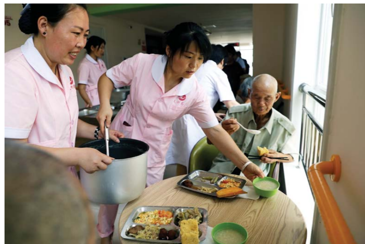
护理人员为老人添粥加饭，“功臣楼”里的一日三餐都由专门的护理人员直接送到老人面前。

“功臣楼”靠沂河岸边的湿地公园，风光秀丽，环境优美。楼内有超宽走廊，阳台宽敞明亮，房间配备独立的卫生间，洗浴设施配套。“功臣楼”建筑面积6000多平方米，有300个房间。据悉，下一步，天河养老服务中心还将邀请当地解放战争、抗美援朝等老兵入住“功臣楼”。