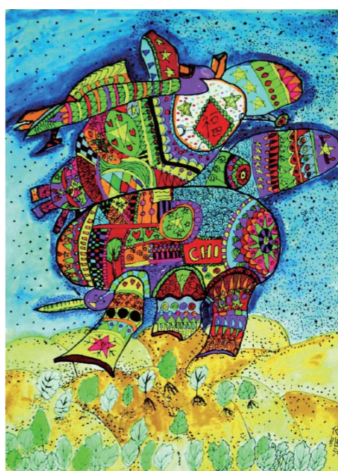
植树机 付继泽 第十二届大赛金奖