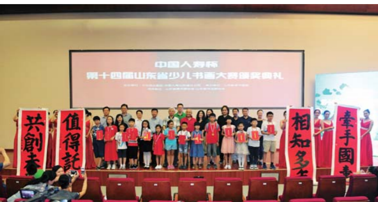
第十四届少儿书画大赛颁奖盛况