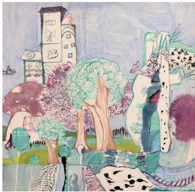
童话世界 马森焯 第十一届大赛金奖