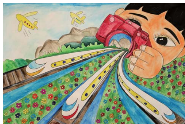
光速时代 杨婧 第十三届大赛金奖