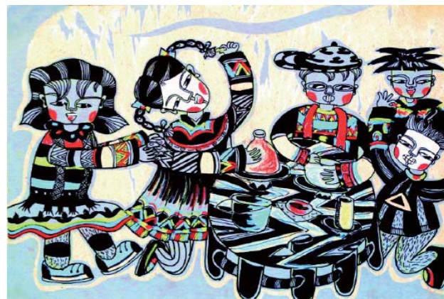
“陶”趣无限 方亚俊 第十二届大赛金奖