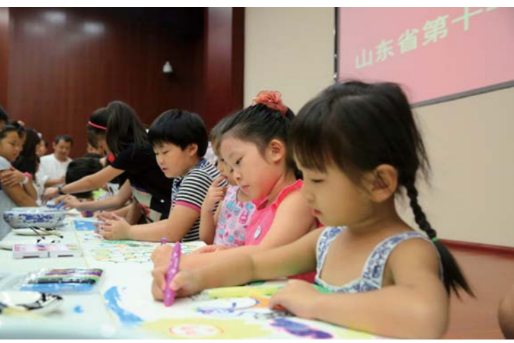
孩子们在颁奖现场作画