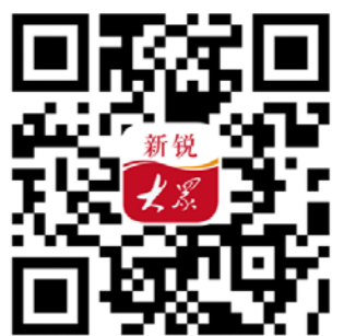
扫描二维码，打开网页，轻松安装新视大众客户端。

本报济南讯 日前，济南市公共创业服务平台在高新区齐鲁文化创意基地启用。 据了解，公共创业服务平台设有创业服务大厅、创客接待室、创客活动室(项目路演室)、政策咨询室、专家指导室等功能服务设施。服务平台由专人负责创业咨询者的接待和咨询信息登记；每周二至周五全天聘请创业指导专家“坐诊”服务；对一些初创项目，创业者也可采取路演的方式，由服务平台组织专家团队进行“会诊”，帮助创业者对项目进行分析指导；对需现场指导服务的企业，可采取“出诊”服务的方式，出诊服务时间采取事前预约，创业者先向指导工作人员提出需求，根据需求由工作人员组织行业专家深入现场进行指导服务，专家“坐诊”和“出诊”的服务费全部由政府买单。为创新服务手段，提升服务质量，平台还将开发“互联网+创业指导”(创业指导APP模块)服务，为创业者提供创业咨询、政策解读、专家预约、专家会诊、专家回访、法律、金融以及优秀创业项目展示等服务。