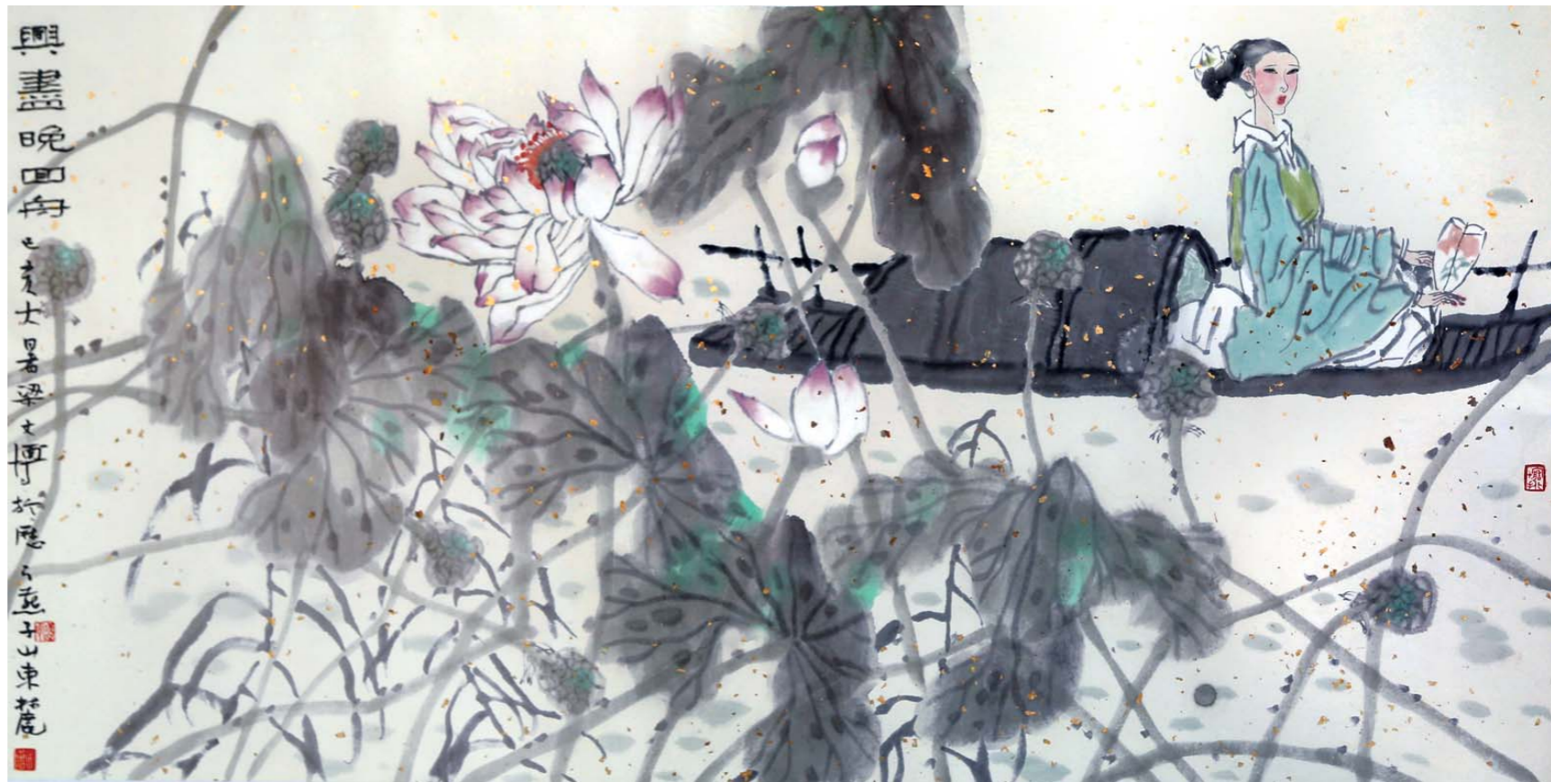
兴尽晚回舟 梁文博 68cm×136cm

梁文博 1956年生于山东烟台。1983年毕业于山东艺术学院美术系，1991年进修于中央美术学院。现为山东艺术学院教授、硕士研究生导师，山东省美术家协会顾问。