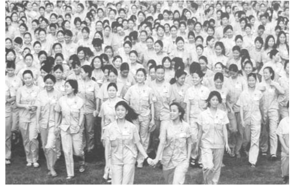
△深圳蛇口工业区的女工(资料照片)。