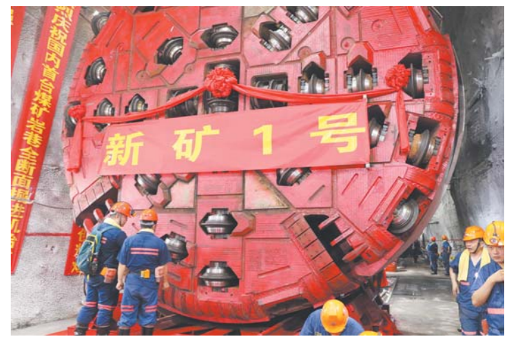
“新矿1号”盾构机始发现场。

□记者 姜言明 卢鹏 通讯员 翟延民 报道 本报济南7月20日讯 常见于隧道掘进的盾构机,如今应用到了井下采煤。今天上午,在山东能源新矿集团新巨龙公司-980米全岩巷道,国内首台煤矿大直径大埋深全断面盾构机“新矿1号”顺利始发。