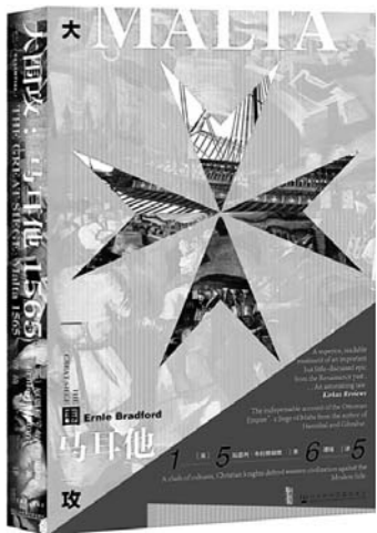
《大围攻》 【英】厄恩利·布拉德福德 著 社会科学文献出版社

无数读者因为《罪与罚》这本小说成了陀翁的忠实粉丝。该书首次把小说和文学评论结合起来，读者不仅可以享受小说的魅力，还可阅读俄罗斯文学研究者对《罪与罚》的评论。