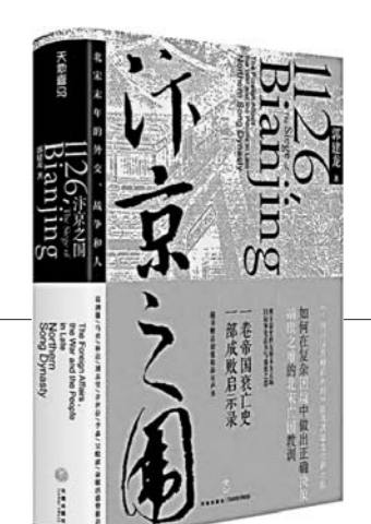
从盛世到灭亡仅隔3年，北宋何以轰然崩溃？作者细致解剖帝国内外的危机根源，深度反思历史。一卷帝国衰亡史，一部成败启示录！

作者根据自己的亲身经历，科学地解答了减肥过程中方方面面的问题，让人读后豁然开朗。