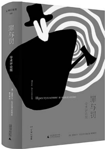
《罪与罚》(学术评论版) 【俄】陀思妥耶夫斯基 著 广西师大出版社

无数读者因为《罪与罚》这本小说成了陀翁的忠实粉丝。该书首次把小说和文学评论结合起来，读者不仅可以享受小说的魅力，还可阅读俄罗斯文学研究者对《罪与罚》的评论。